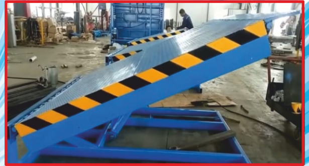
Tıp-E Menteşeli Rampa